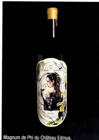
Magnum de Phi du Château Edmus.